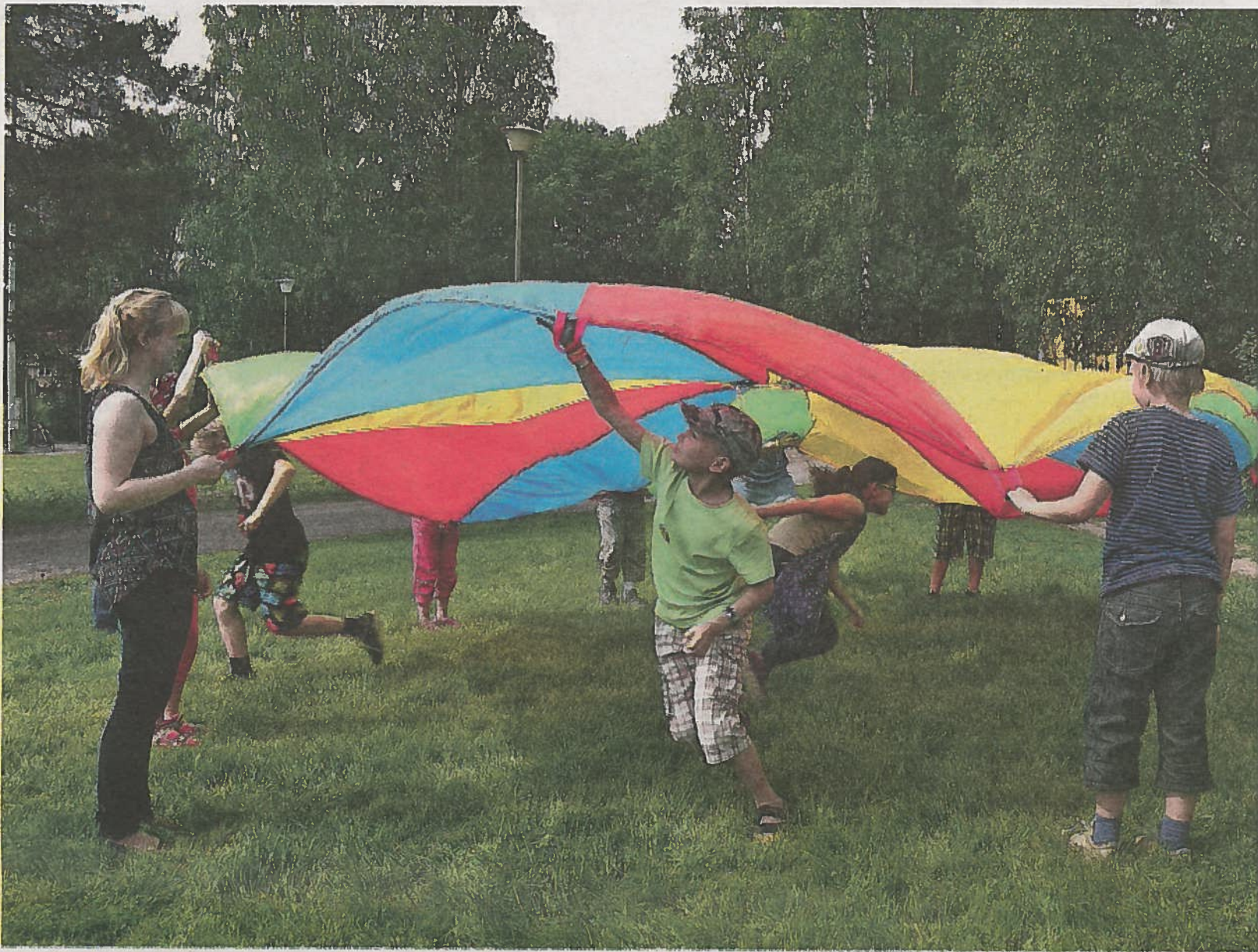
Kielileirin ruotsin ryhmäläiset opettelivat värejä ja numeroita leikkivarjon innostamana.

Lähde: Nikkola, Tiina & Rautalainen, Matti & Rähä, Pekka (toim.): Toinen tapa käydä koulua. Kokemuksen, kielen ja tiedon suhde oppimisessa (Vastapaino 2013).